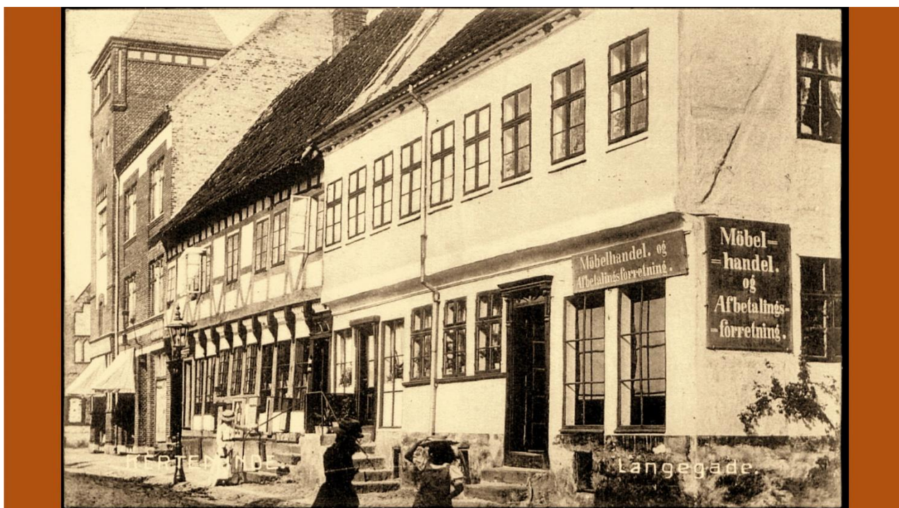
Langegade 8, Farver Hinkes Gaard, (Museet for Kerteminde og Omegn), Kerteminde.