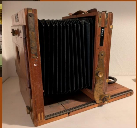
Fra udstillingen i Kerteminde.