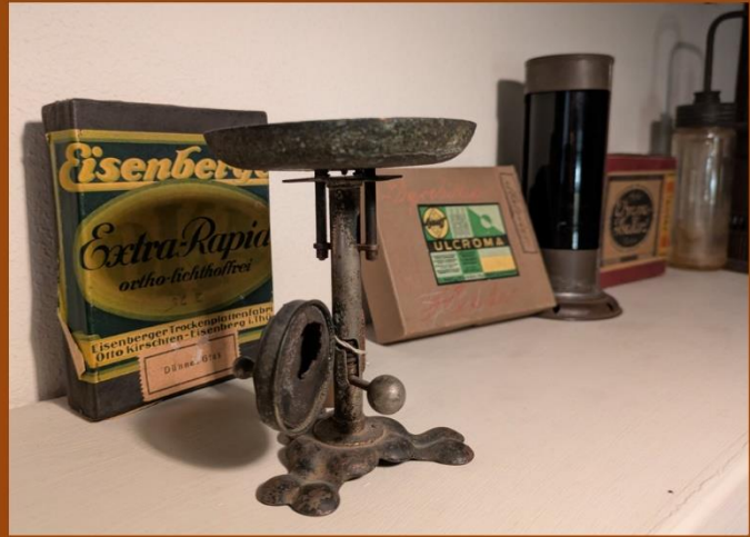
Fra udstillingen i Kerteminde. Pladekamera, holder til "magnesiumbombe", æsker til tørplader og rødt glas til mørkekammerarbejdet.