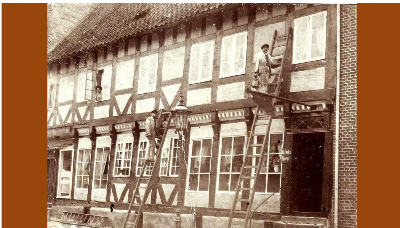
Marthal Kroghs fotografi af istandsættelsen af Farvergårdens facade. O. 1910.