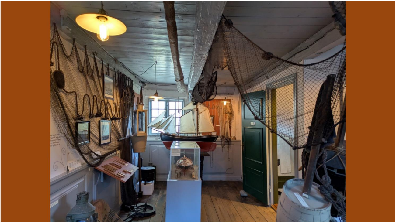
Fra det kulturhistoriske museums udstillinger, der fortæller om købstadens liv og erhverv.